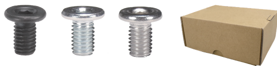
EBSS EBSM EBSTS